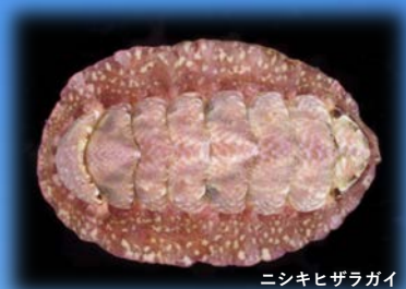
ニシキヒザラガイ