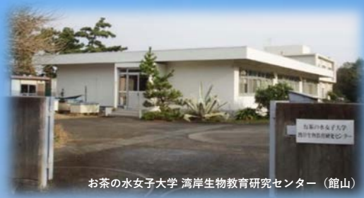
お茶の水女子大学 湾岸生物教育研究センター（館山）