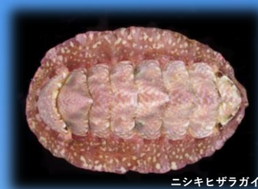
ニシキヒザラガイ