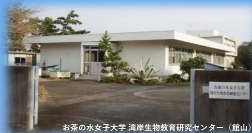
お茶の水女子大学 湾岸生物教育研究センター（館山）