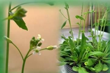
モデル植物のシロイヌナズナ

日時：第2回：2024年5月5日（日） 9:00～12:00 第3回：2024年5月5日（日） 14:00～17:00 ※ 第2回と第3回は同じ内容です。