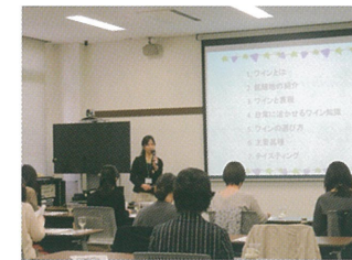
全体修了式後の交流会 (ワイン講座)の様子